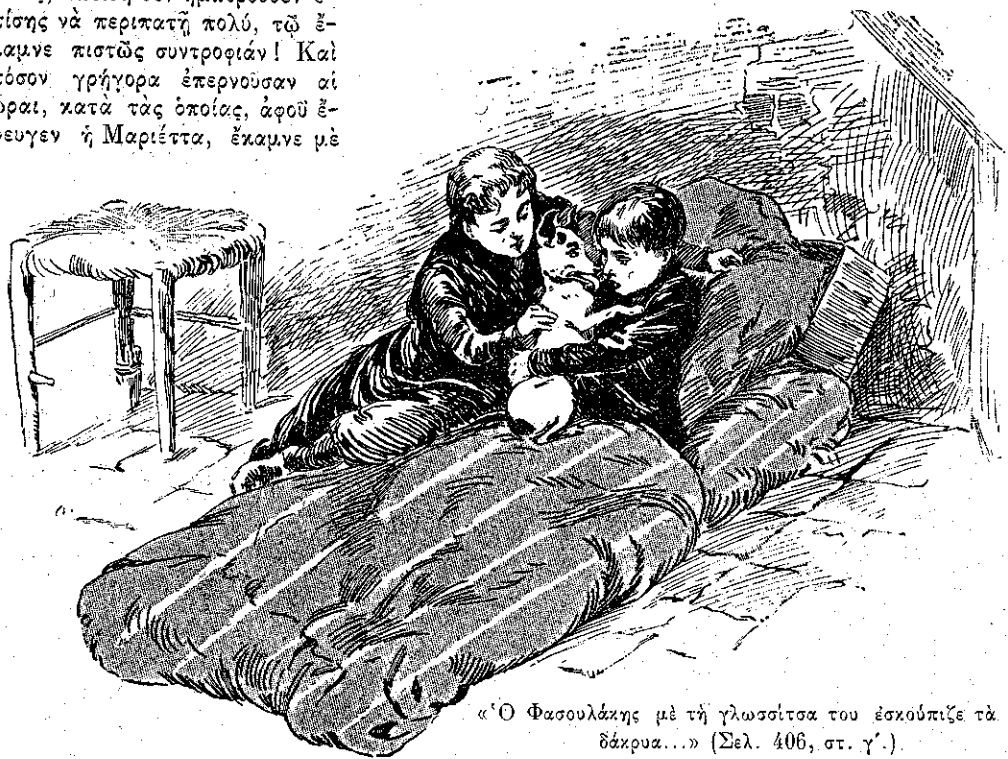
«Ὁ Φασουλᾶκης μὲ τὴν γλωσσίσσαν του ἐσκόμπιζε τὰ δάκρυα...» (Σελ. 406, στ. γ')

— Καὶ ποῖός θὰ μάθῃ τώρα πῶς τὸ ἡῆρες ἐσὺ! εἶπεν ὁ μικρὸς, ἀρπάζων οἶονεἰ σανίδα σωτηρίας.