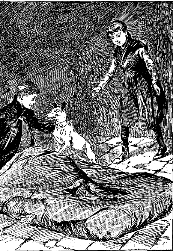
Ἐἶνε γιὰ μένα; . . . Εἶνε δικὸς μου; . . . (Σελ. 405 στ. γ')

— Ἐνοεῖται πὺς εἶνε δικὸς σου! Τὸν εὐρήκα ἐπὶ δρόμο, ἀπέξω ἀπὸ ἕνα πα- λησοπιτοκαμένο, ὅπου ποῖς ἔφερε ποῖα κακὰ παιδιὰ τὸν εἶχαν δέσῃ. Νάβλεπες πὺς μ' ἐφίλησε ὅταν τοῦ ἐκοῦφα τὸ σχοινί ποῦ τὸν ἐπνιγε! Λές και ἤθελε νὰ μοῦ πῆ εὐχαριστῶ. Ἐπειτὰ ἔκαμε νὰ με ἀκολουθήσῃ. Ἐπειδὴ ὄμως τὸν εἶχαν κτυπήσῃ και ἦταν ματωμένος, ἐκα- τάλαβα πὺς θὰ πονοῦσε και τὸν πῆσα ἐπὶ χέρι. Ἐτσι τὸν ἔφερα ὡς ἐδῶ γιὰ νὰ σοῦ τὸν χαρίσω. Εἶσ' εὐχαριστημένος, Ἀν- δρῆκό μου;